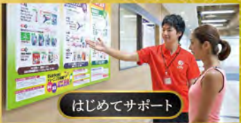
はじめてサポート